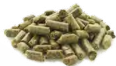
Tourtes de chanvre

Des matériaux n'étant pas aptes à l'écoulement, comme des épices, des racines ou des tourteaux sont concassés préalablement sans aucun problème.